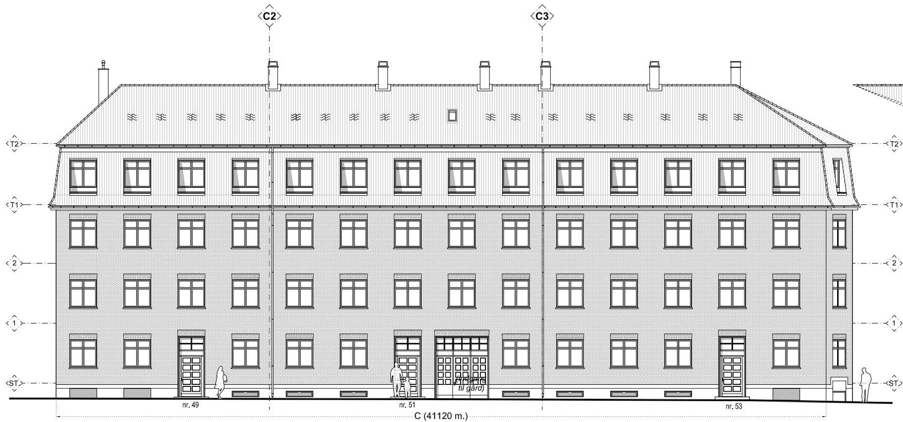
BYGNING "C" / OPSTALT MOD ROVSINGSGADE - EKSISTERENDE FORHOLD, MÅL 1:200