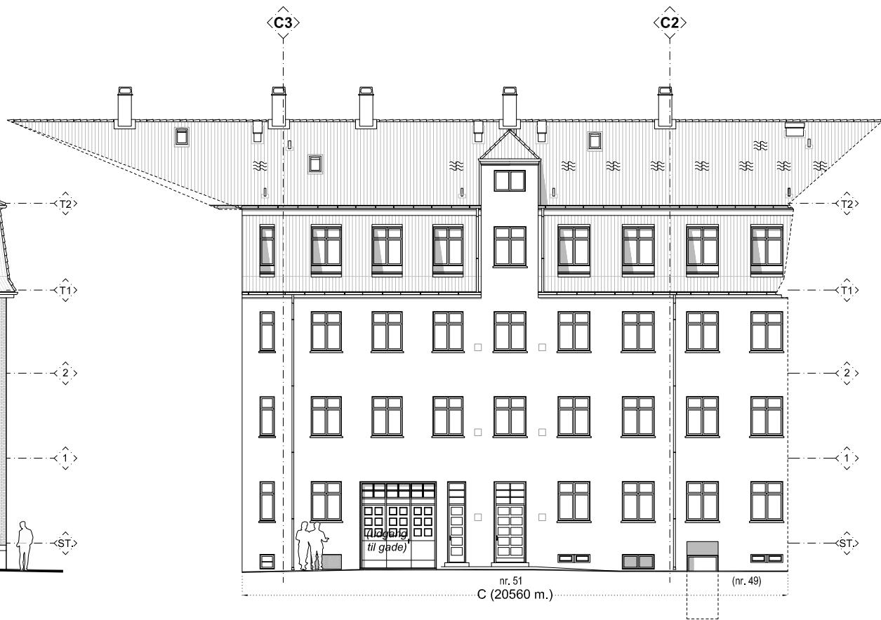
BYGNING "C" / OPSTALT MOD GÅRD - EKSISTERENDE FORHOLD, MÅL 1:200